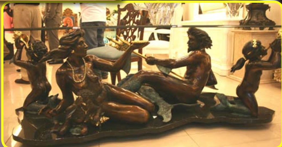
“Los Atlántidas”. Base para mesa de comedor. Pieza única de bronce del escultor Carlos Espino y que forma parte de esta gran exposición.